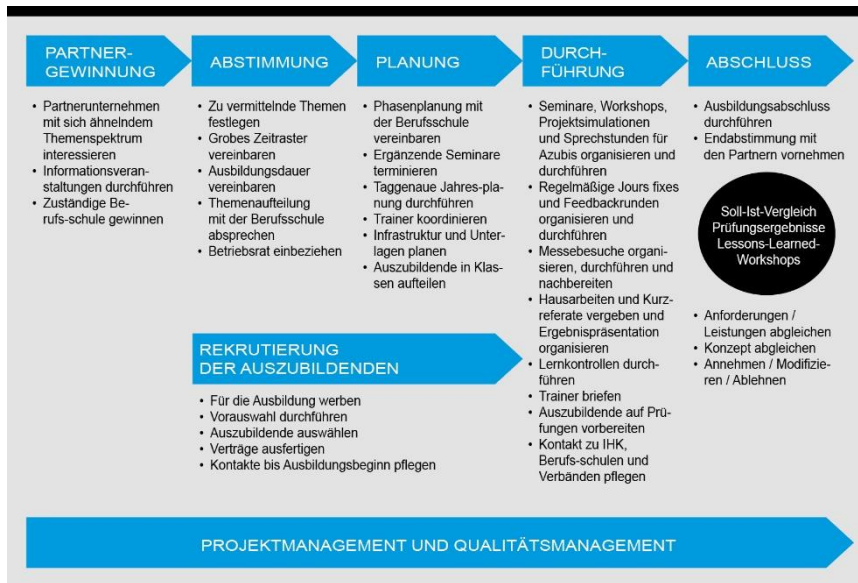
Aufbau Duale Ausbildung